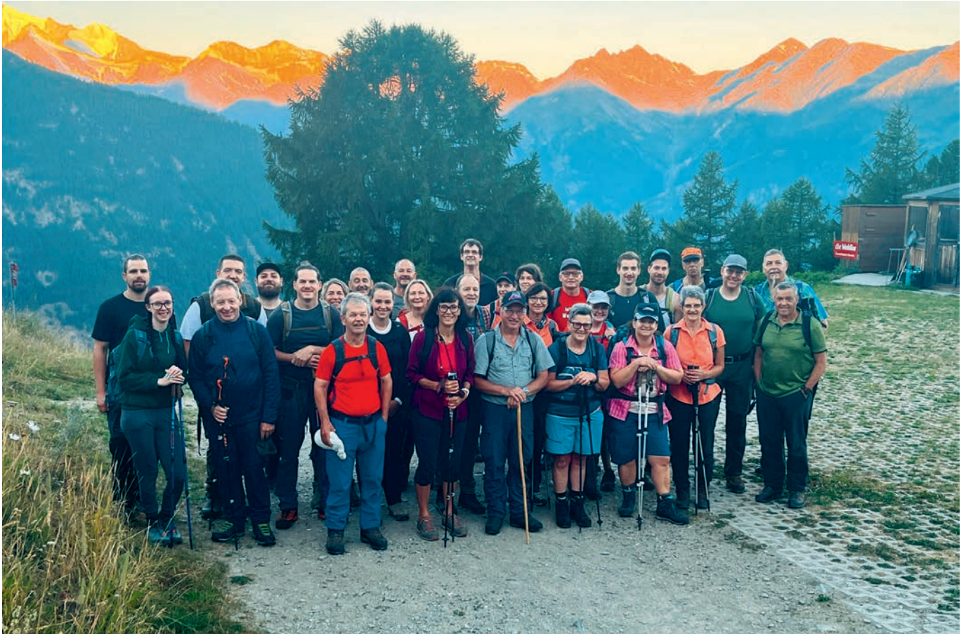
Mehr als 30 Personen nahmen an der Nostalgiewanderung mit Ziel Alphütte im Cheller teil.

Nach drei Jahren Sanierungsarbeiten konnte am Sonntag, 11. August 2024 die Alphütte im Cheller feierlich eingeweiht werden. Verbunden wurde die Einweihung mit der Nostalgiewanderung, die nach 2014 zum dritten Mal durchgeführt werden konnte.